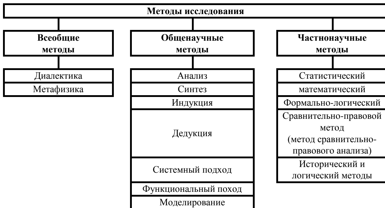
Рисунок 1 – Методы научного исследования

Если отдельные результаты, методики были внедрены в практическую деятельность, то это следует указать в данном разделе и приложить акт о внедрении (Приложение 7).