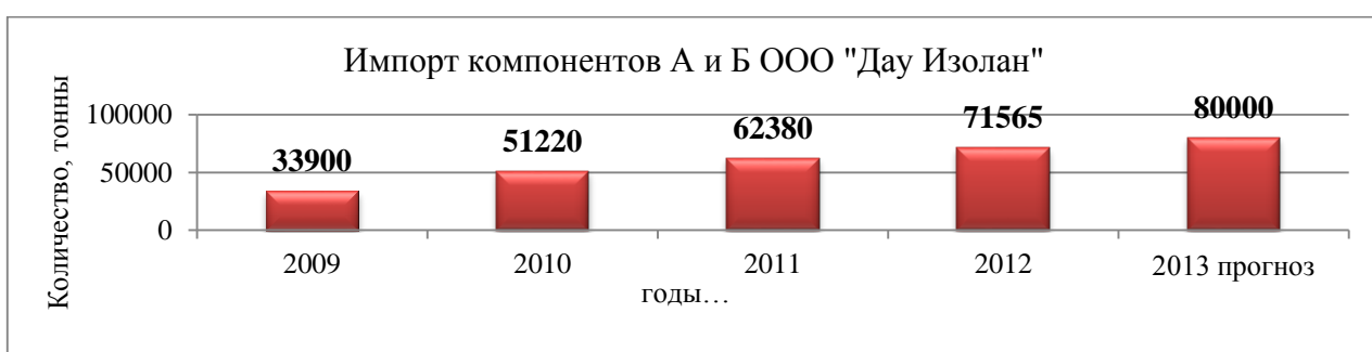
Рисунок 8 – Импорт компонентов А и Б ООО «Дау Изолан», тонн

Если иллюстрация выполнена автором не самостоятельно, а заимствуется, то сразу после рисунка следует указать источник заимствования.