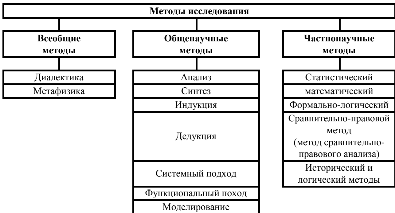
Рисунок 1 – Методы научного исследования