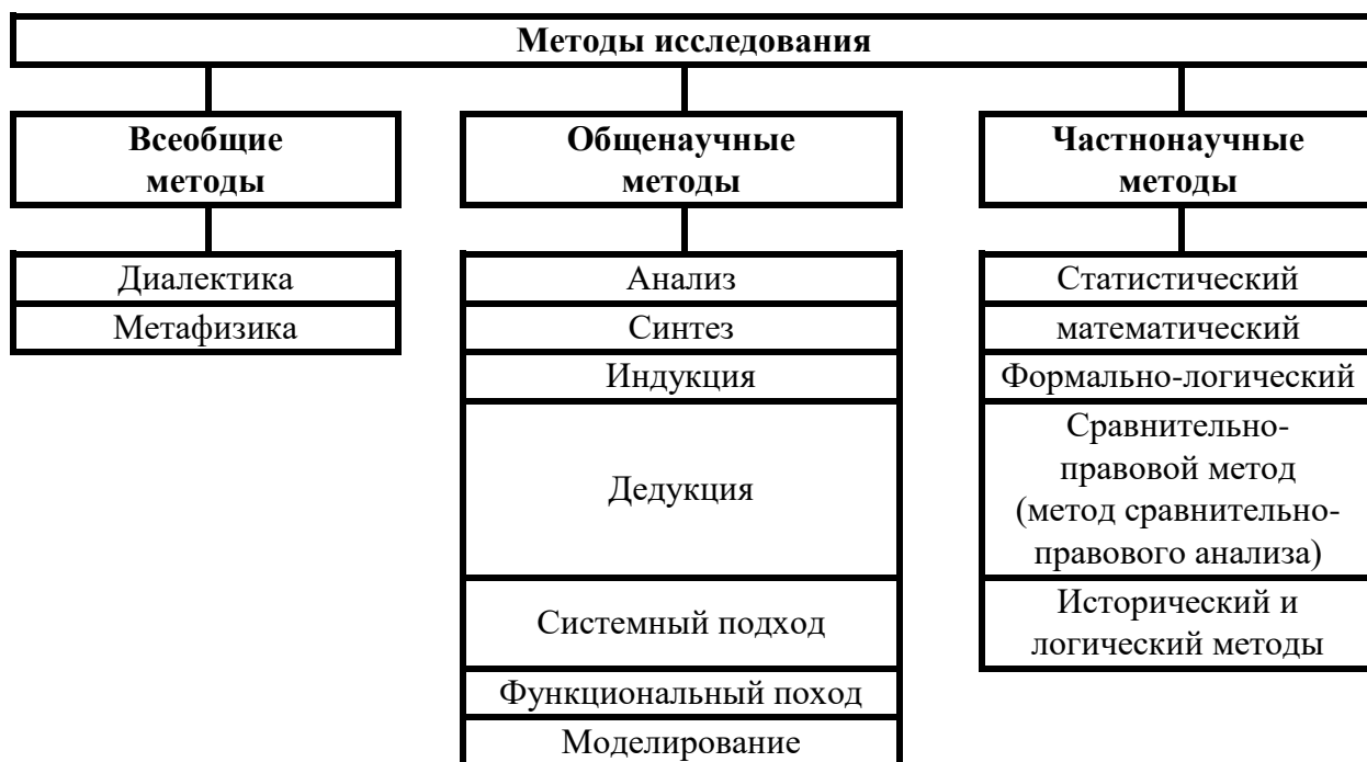
Рисунок 1 – Методы научного исследования

« Методологическую основу исследования составляет комплекс мер научного познания, среди которых общенаучные методы анализа, синтеза, индукции, дедукции, а также частнонаучные: системный анализ, моделирование, логический метод и др.»