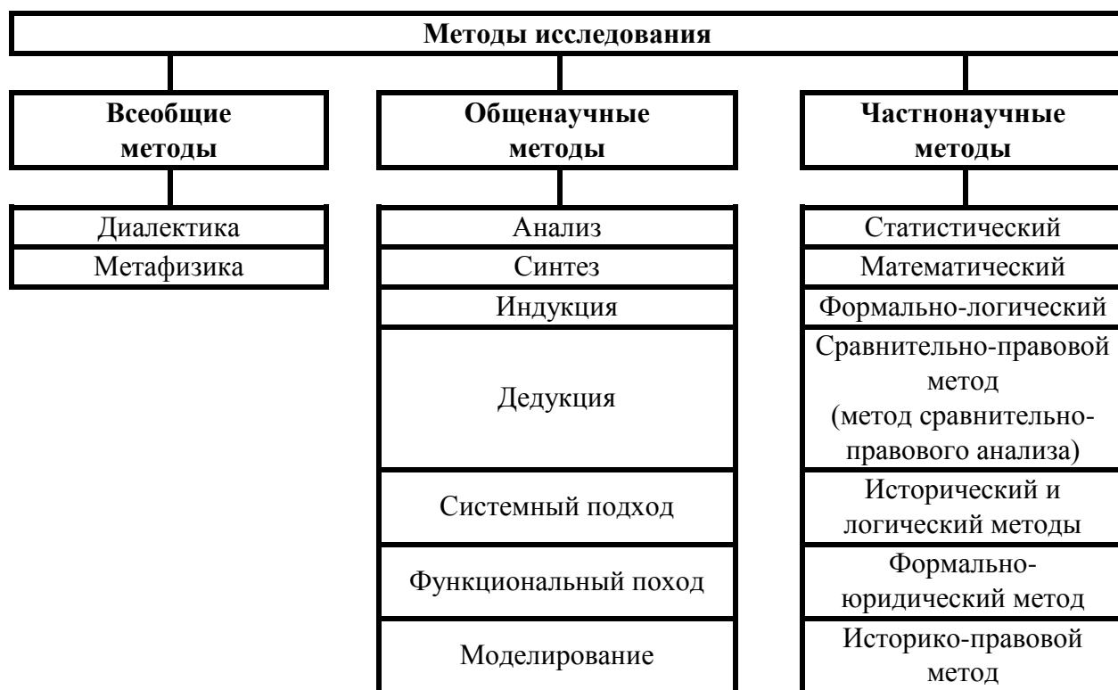
Рисунок 1 – Методы научного исследования

Методологическая основа исследования содержит перечисление подходов и методов, которые были использованы автором при решении поставленной проблемы. Методы исследования – это способы познания объективной действительности (Рисунок 1).