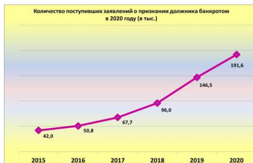
Рисунок 4 – Количественный показатель поступивших заявлений о признании должника банкротом за 2015-2020 годы

Совокупное количество заявлений о несостоятельности, поданных в Арбитражные суды Российской Федерации о банкротстве в 2020 году выросло по сравнению с предшествующим периодом (2019 годом) на 30,8 % и составило 191 604 процедуры (Рисунок 4).