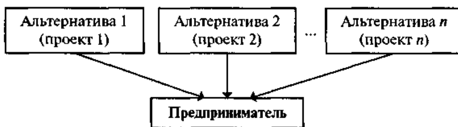
Рис. 2. Схема технологии принятия предпринимательского решения