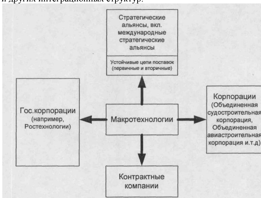
Рис 4.2. Возможные организационные формы реализации макротехнологий

Макротехнология на организационно-хозяйственном уровне - это форма организационной интеграции, включающая в себя целый спектр координационных механизмов (рис. 3.2) от контрактных связей до стратегических альянсов, сетевых объединений и других интеграционных структур.