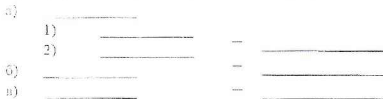
Рисунок 2 – Примеры оформления списков

ж) Внутри глав, подглав, разделов и подразделов могут быть приведены перечисления, которые записываются с абзацного отступа. Перед каждой позицией перечисления следует ставить дефис, а при необходимости ссылки в тексте ВКР на один из элементов перечисления вместо дефиса ставятся строчные буквы в порядке русского алфавита, начиная с буквы «а» (за исключением букв ё, з, й, о, ч, ь, ы, ь). Для дальнейшей детализации перечислений необходимо использовать арабские цифры, после которых ставится скобка, а запись производится с абзацного отступа. Примеры оформления списков представлен на рисунке 2.