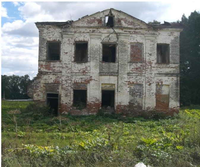
Господский дом. Фото 2011 г.