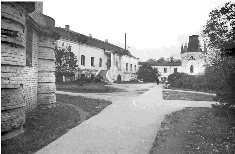
Фото усадебного дома

Усадебный дом. Фото 1970-х гг.