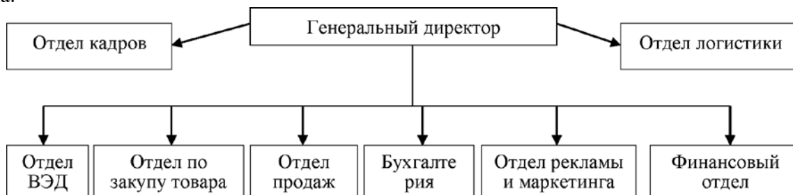
Рисунок 1.3 - Организационная структура ООО «Востокшинторг» в 2015 г.

При ссылках на иллюстрации следует писать «... в соответствии с рисунком 2» при сквозной нумерации и «... в соответствии с рисунком 1.2» при нумерации рисунка в пределах раздела.