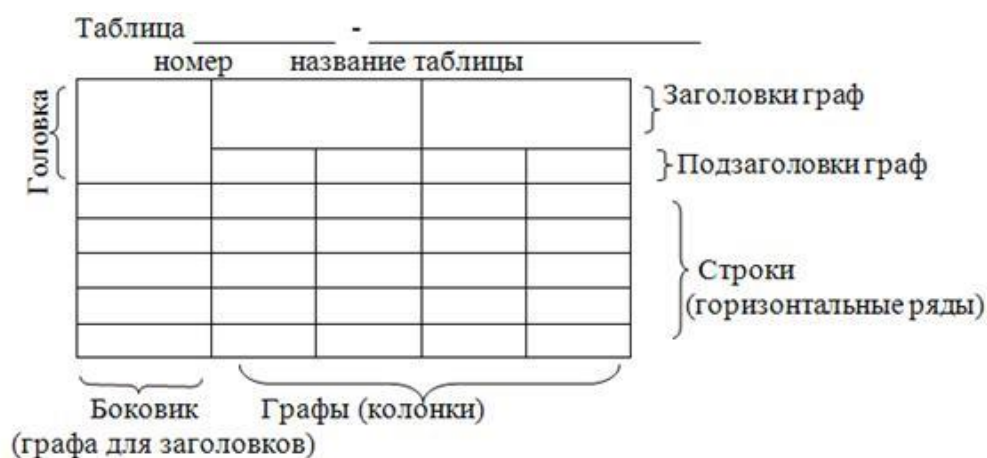
Рисунок 1 - Оформление таблиц

Таблицы выравниваются по центру страницы и оформляются в соответствии с рисунком 1. Выше и ниже каждой таблицы должно быть оставлено не менее одной свободной строки.