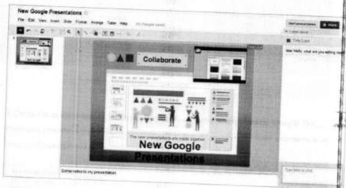
Рис.3. Google Презентация

4.Создайте презентацию. Используйте необходимые инструменты Google Docs. Экспортировать презентацию в формате PDF, PPT или TXT. Обязательно добавить в презентацию изображения и видео.