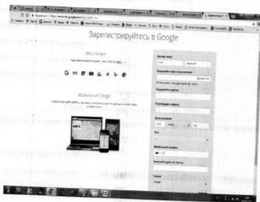
Рис.1. Регистрация в Google