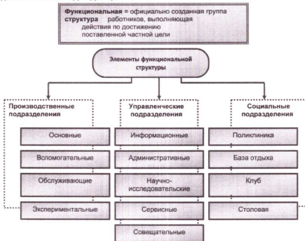
Схема функциональной структуры организации