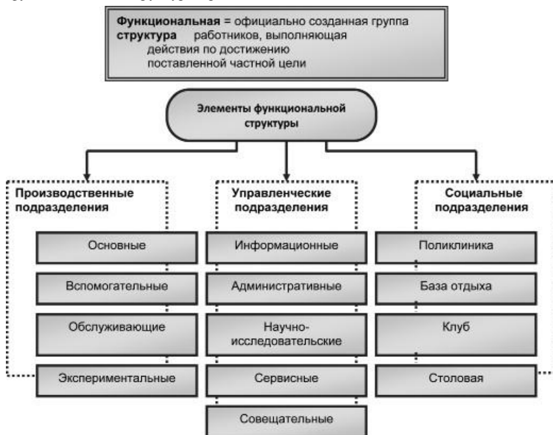
Схема функциональной структуры организации