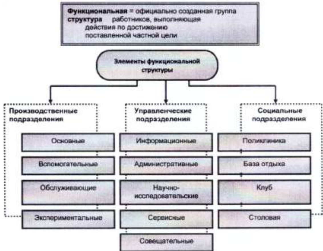
Схема функциональной структуры организации