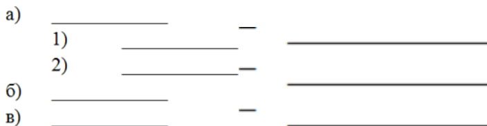
Рисунок 1. Примеры оформления списков