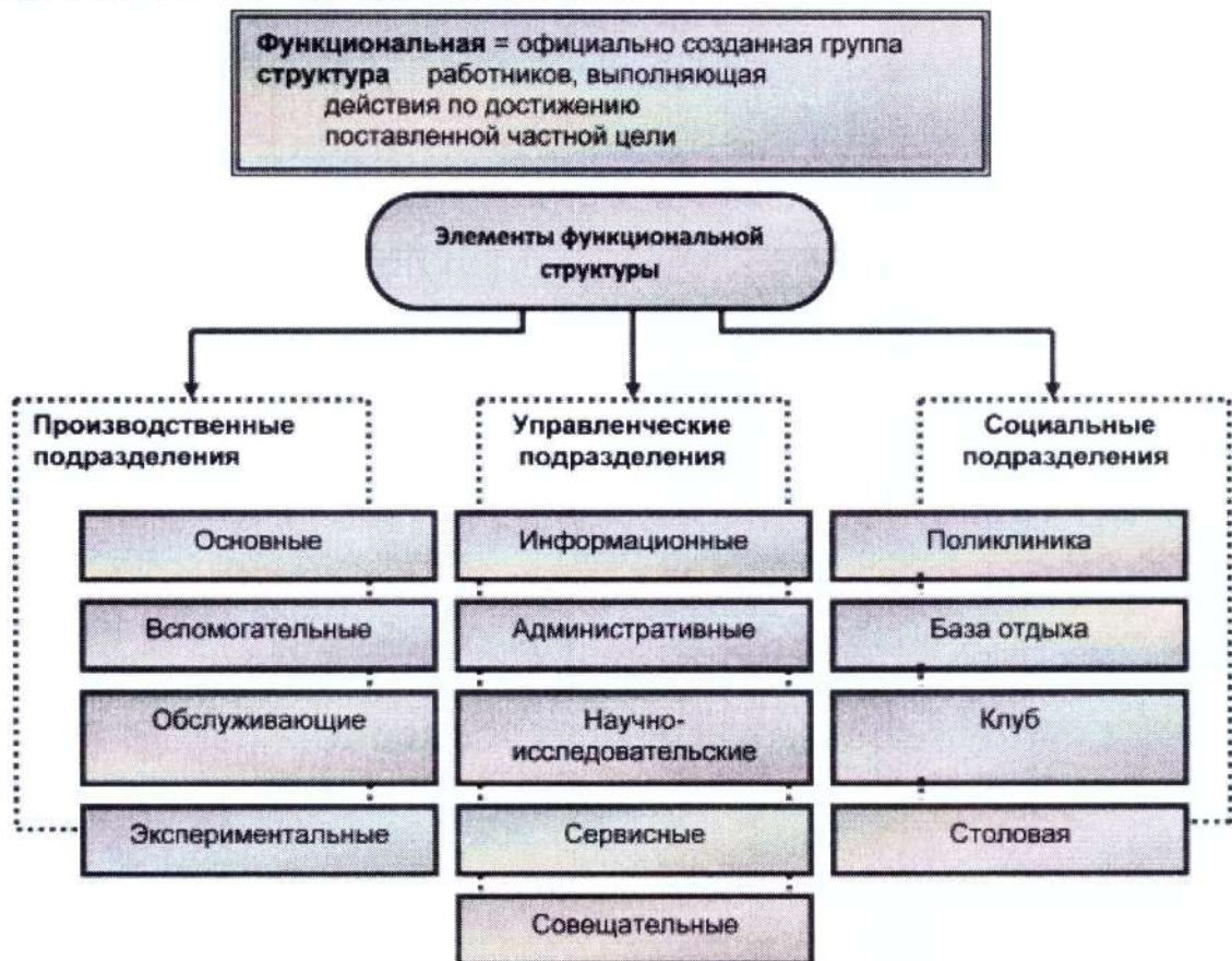
Схема функциональной структуры организации