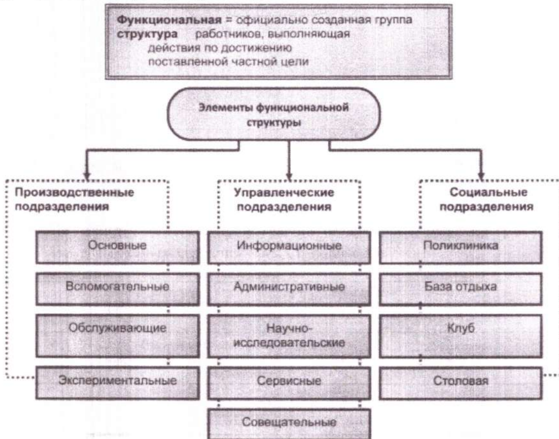
Схема функциональной структуры организации