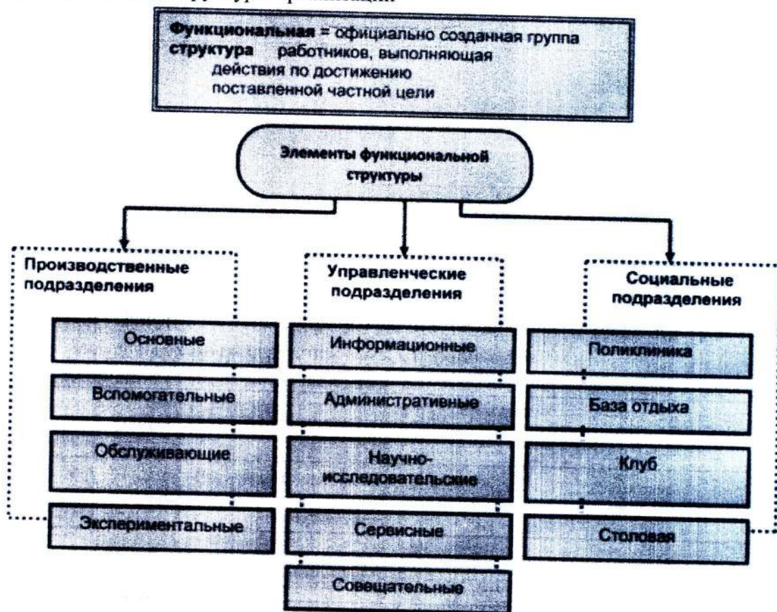
Схема функциональной структуры организации