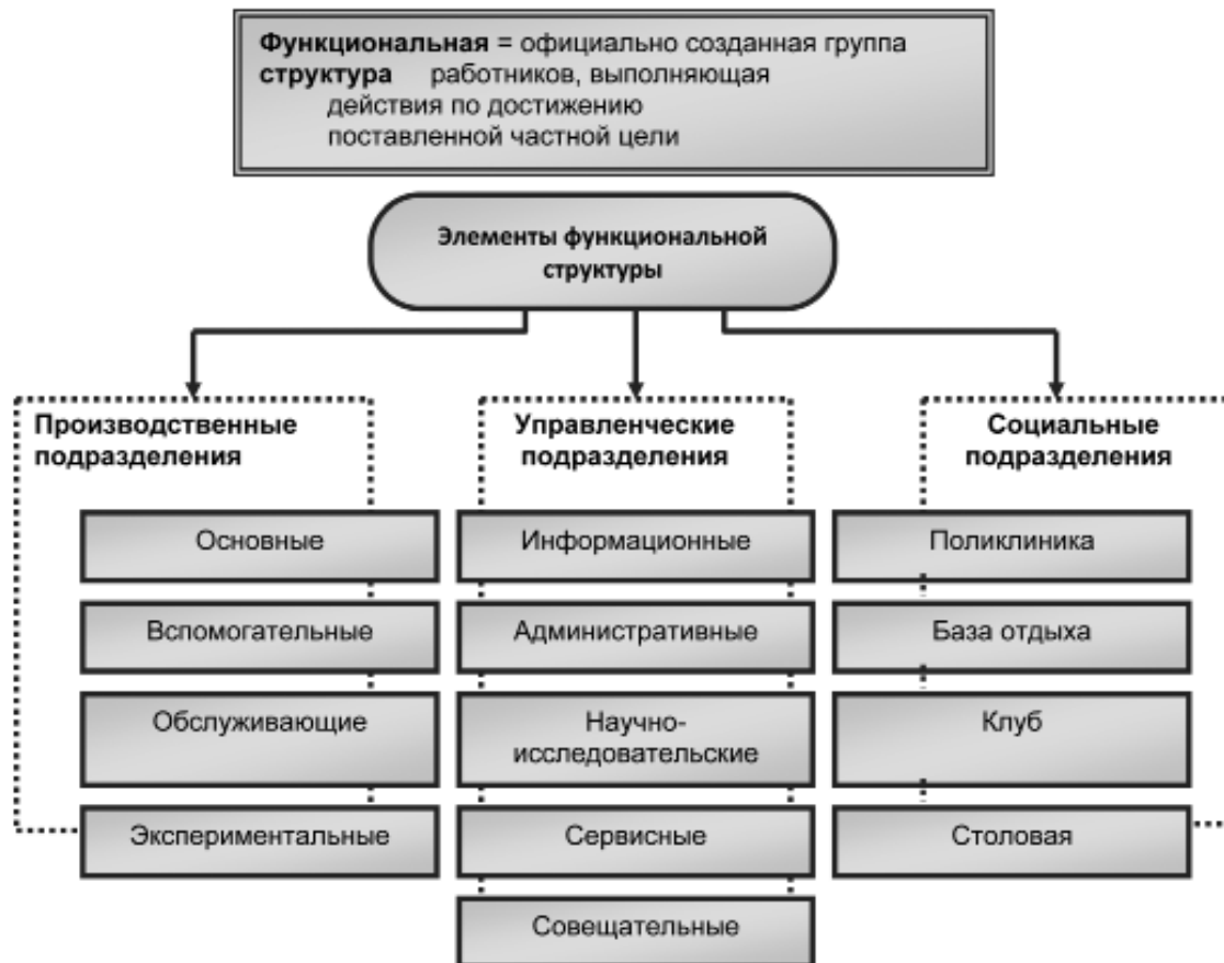
Схема функциональной структуры организации