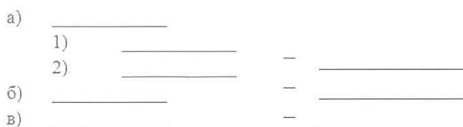
Рисунок 1. Примеры оформления списков