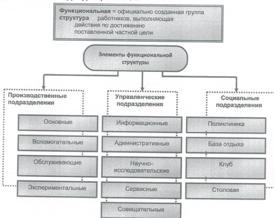
Схема функциональной структуры организации