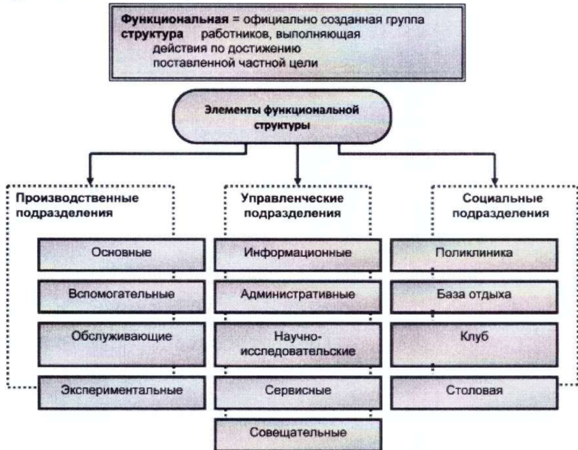
Схема функциональной структуры организации