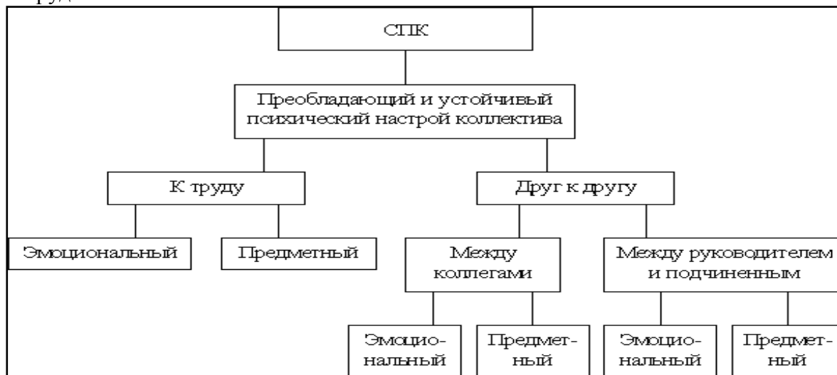
Рис. 1. Факторы, влияющие на социально-психологический климат в коллективе.