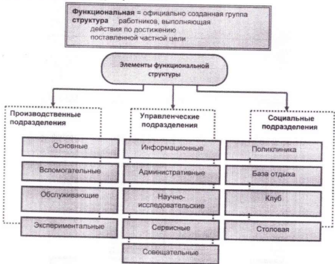
Схема функциональной структуры организации