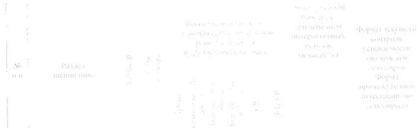
Рисунок 1. МЕТОДОЛОГИЧЕСКИЕ ПОДХОДЫ К ВОСПИТАНИЮ СТУДЕНТОВ НА КАРГОДОВОМ УРОВНЕ КОМПЕТЕНЦИОНАЛЬНОСТИ В ОБЛАСТИ ЭКОНОМИЧЕСКОГО АНАЛИЗА И СТАТИСТИЧЕСКОГО АНАЛИЗА ДАННЫХ

Общая трудоемкость дисциплины: 120 часов в расчете на 1 студента