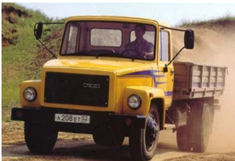
Рис. 5.1. Автомобиль ГАЗ – 3309

Правда значительно увеличились закупки подвижного состава из других стран, особенно легковых автомобилей. Для массовых пассажирских перевозок используются автобусы ЛИАЗ Ликинского автобусного завода в Московской области, "Икарус" венгерского производства, ПАЗ Павловского завода в Нижегородской области и др. В связи со старением парка и прекращением закупок новых автомобилей осуществляется модернизация автобусного парка,