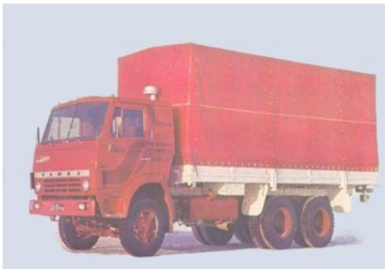
Рис. 5.2. Автомобиль КамАЗ - 53212

Правда значительно увеличились закупки подвижного состава из других стран, особенно легковых автомобилей. Для массовых пассажирских перевозок используются автобусы ЛИАЗ Ликинского автобусного завода в Московской области, "Икарус" венгерского производства, ПАЗ Павловского завода в Нижегородской области и др. В связи со старением парка и прекращением закупок новых автомобилей осуществляется модернизация автобусного парка,