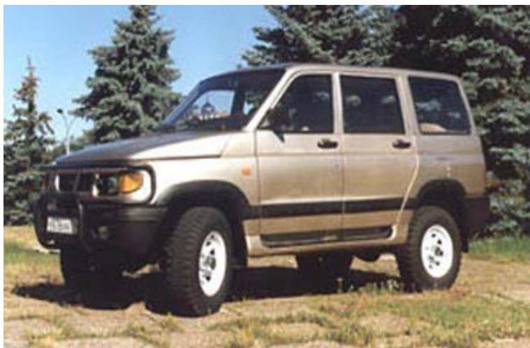
Рис. 5.3. Легковой автомобиль УАЗ – 3160

В Татарии выпускаются небольшие двухдверные легковые автомобили "Ока". Остальную часть парка составляют автомобили иностранного производства. Инфляция и постоянный рост цен на автомобили несколько сдерживают покупательский спрос на них, что вызывает кризис в отечественном автомобилестроении, необходимость повышать качество и конкурентоспособность его продукции.