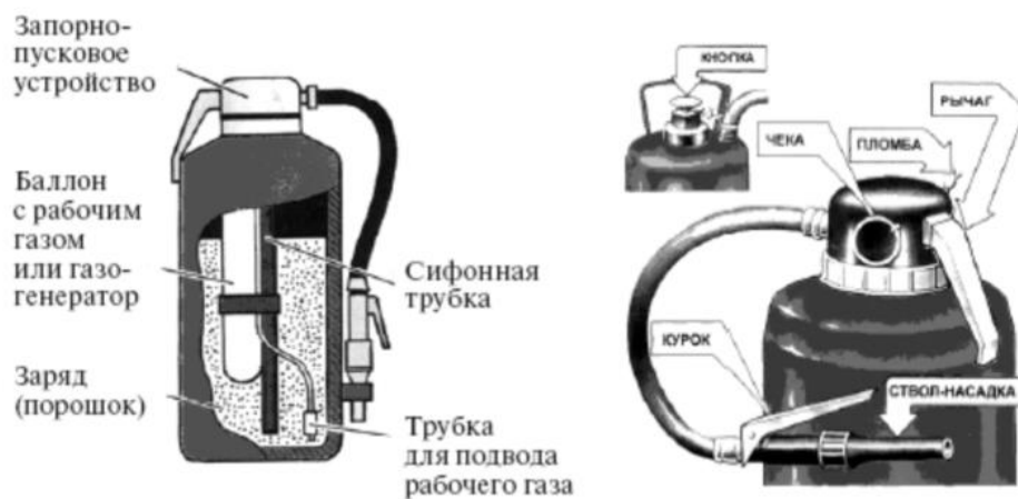
Рис. 26. Порошковый огнетушитель со встроенным газовым источником давления ОП-5

Чтобы привести в действие огнетушитель ОП-5 необходимо сорвать пломбу, выдернуть чеку, поднять рычаг до отказа, направить ствол-насадку на очаг пожара и нажать на курок; через 5 секунд приступить к тушению пожара.