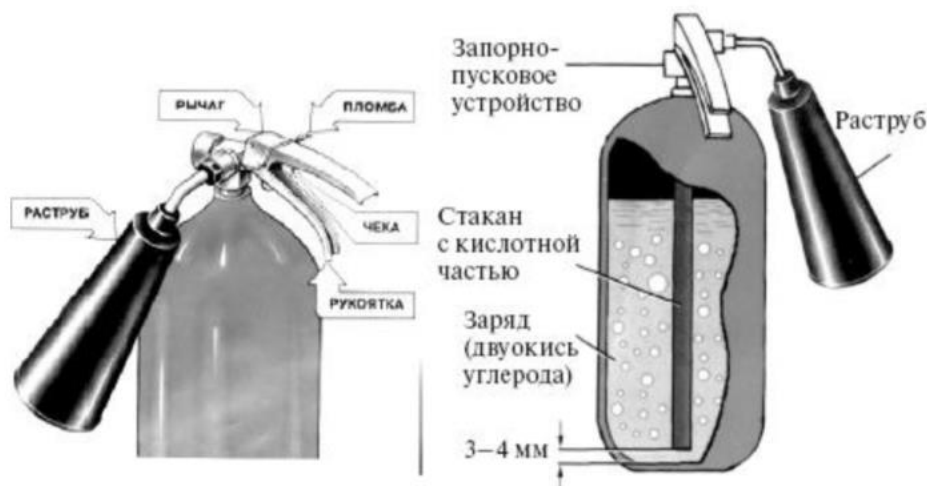
Рис. 25. Углекислотный огнетушитель ОУ-2

У огнетушителя ОУ-2 раструб присоединен к корпусу шарнирно. Кроме того, огнетушитель имеет предохранительное устройство мембранного типа, которое автоматически разряжает баллон огнетушителя при повышении в нем давления сверх допустимого.