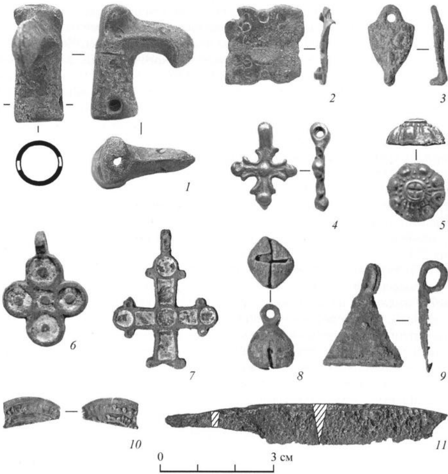
Рис. 2. Индивидуальные находки, полученные в результате сборов на территории селища Городище 1 (Клещин) в районе места обнаружения подвески со знаком Рюриковичей

1–9 – цветной металл; 10 – серебро; 11 – железо