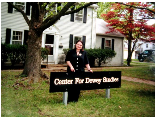
Южно-Иллинойский университет, Карбондейл. Центр изучения Дьюи, США -2003 г.

В первое десятилетие своего существования этот Центр исследований Дьюи поддерживался главным образом Южно-Иллинойским университетом. С 1974 года благодаря Фонду Дьюи и двум частным спонсорам университетский проект стал получать огромную поддержку в своих исследованиях и издании трудов ученого. В 1961 году, спустя девять лет со дня смерти Дьюи, лишь некоторые из его крупных работ были напечатаны. Хотя его наследие, содержащее более тысячи работ по разнообразным отраслям науки и существовало, многие работы ученого были разбросаны в разных местах, несколько работ были напечатаны только на французском, испанском, японском и китайском, а оригинальные версии на английском языке были потеряны. Более того, каждый год с 1882 по 1953 год Дьюи публиковал от одного до 30 различных произведений, многие из которых появлялись в журналах, которые не всегда были в центре внимания читательской аудитории. Среди них многочисленные памфлеты, обзоры, письма в редакцию, статьи в энциклопедиях, а также лекции, которые никогда не перепечатывались и не собирались. Помимо того, что его работы касались полного спектра тем, начиная с проблем эстетики и архитектуры до утилитаризма и теории ценностей, отдельные из них обычно сочетали в себе различные акценты. Поскольку корпус работ Дьюи сложен и многогранен, Центру в Карбондейле пришлось очень долго искать многие наработки ученого. На протяжении 75 лет со дня публикации его первой работы в 1882 году (накануне 23-х летия Дьюи)