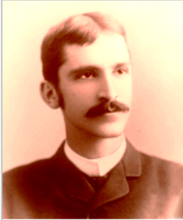
John Dewey in Ann Arbor, circa 1885